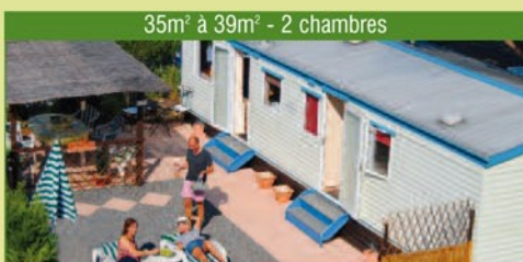
35m 2 à 39m 2 - 2 chambres

SUPÉRIEUR : Situés au niveau 10 du site, 35 m 2 - 39 m 2 , 2 chambres (1 lit double, 2 lits simples), canapé convertible dans le séjour, climatisation, TV, grande cuisine équipée (frigo, congélateur, micro ondes, cafetière électrique), salle de douche avec WC, grande terrasse en partie couverte d'une pergola en canisse avec salon de jardin et 2 bains de soleil.