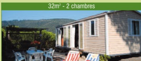
32m 2 - 2 chambres

CONFORT : 32 m 2 , 2 chambres (1 lit double, 2 lits simples), canapé convertible dans le séjour, cuisine équipée (frigo, congélateur, micro ondes, cafetière électrique), salle de douche avec WC, terrasse en partie couverte d'une pergola en canisse avec salon de jardin et 2 bains de soleil. Pas de TV.