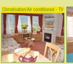
Climatisation/Air conditioned - TV

PANORAMIQUE : Located on the highest level of the campsite with a magnificent view of the surrounding valley. 37 m 2 - 40 m 2 , 2 bedrooms (1 double, 2 single beds) or 3 bedrooms (extra bedroom 2 single beds), sofa bed in the living room, air conditioning, TV, equipped kitchen (fridge freezer, microwave, coffee maker), shower room with toilet, very large terrace with a straw umbrella shade with garden furniture and 4 sunloungers.