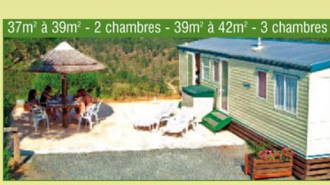
37m 2 à 39m 2 - 2 chambres - 39m 2 à 42m 2 - 3 chambres

PANORAMIQUE : 37 m 2 - 42 m 2 , situés sur le niveau supérieur du site avec une vue magnifique sur la vallée. 2 chambres (1 lit double, 2 lits simples) ou 3 chambres (chambre supplémentaire 2 lits simples), canapé convertible dans le séjour, climatisation, TV, grande cuisine équipée (frigo, congélateur, micro ondes, cafetière électrique), salle de douche avec WC, très grande terrasse en partie couverte d'un parasol en paille avec salon de jardin et 4 bains de soleil.