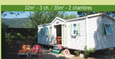
32m 2 - 3 ch. / 35m 2 - 2 chambres

CONFORT FAMILY : de 32m 2 2 ou 3 chambres (1 lit double, 2x2 lits simples) à 35m 2 2 chambres (1 lit double, 2 lits simples), canapé convertible dans le séjour, climatisation, cuisine équipée (frigo, congélateur, micro ondes, cafetière électrique), salle de douche avec WC, terrasse en partie couverte d'une pergola en canisse avec salon de jardin et 2 bains de soleil. Pas de TV.