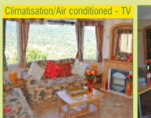
Climatisation/Air conditioned - TV